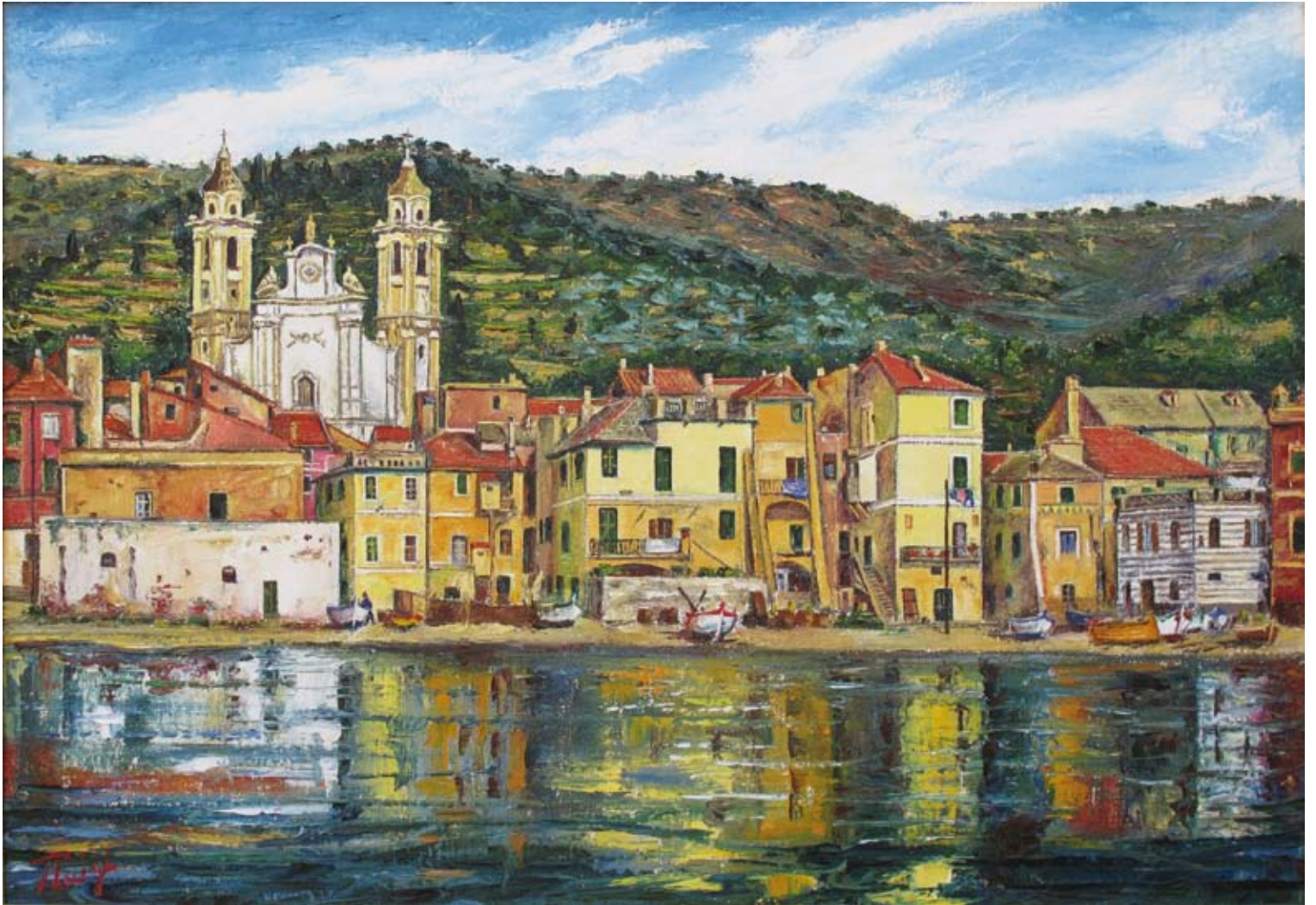
Pierluigi Colombo "Laigueglia si specchia nell'eterno mare" - VL 1909 (olio su tela cm 70x100)