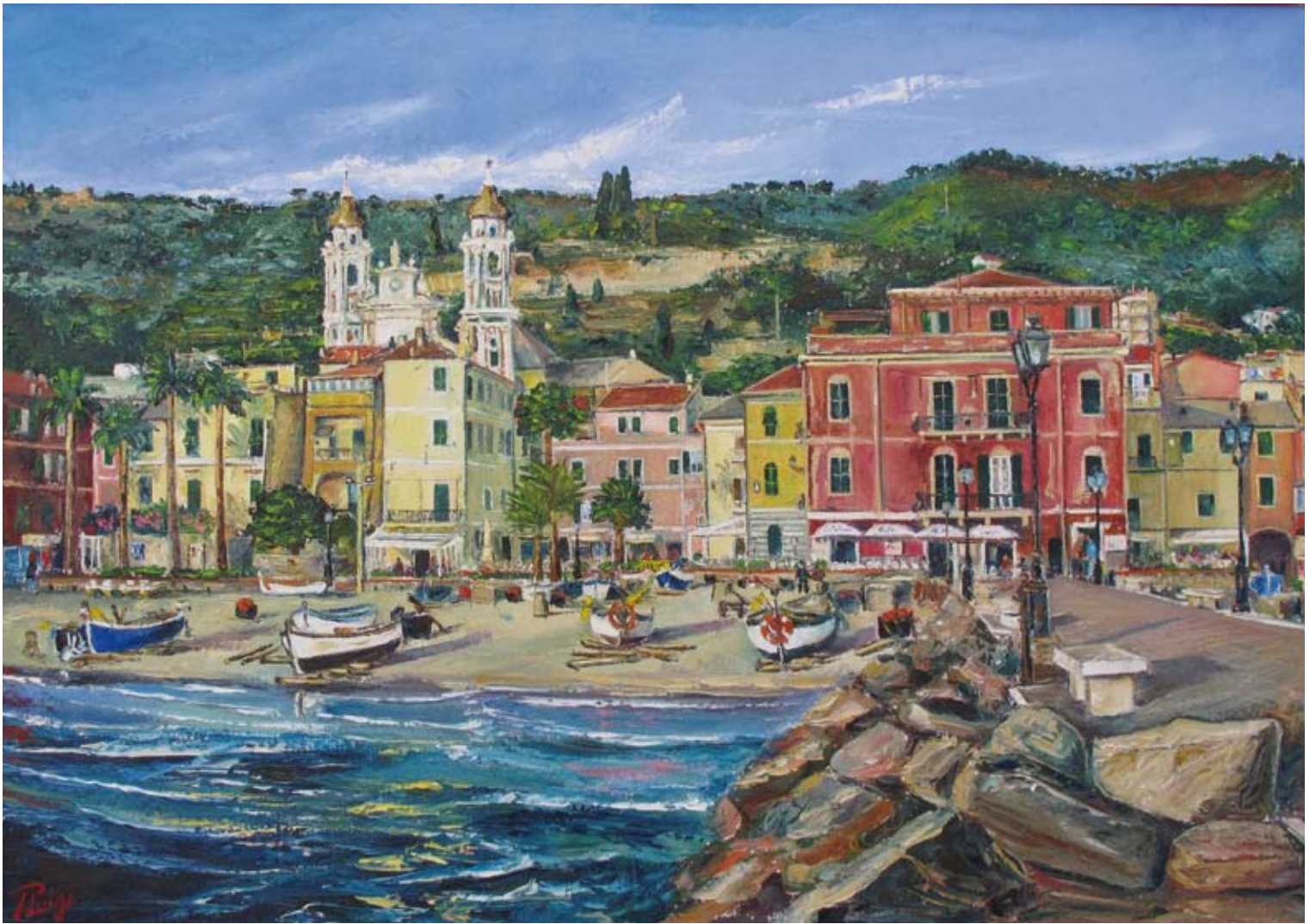
Pierluigi Colombo "Stupendo!" (olio su tela cm 70x100)