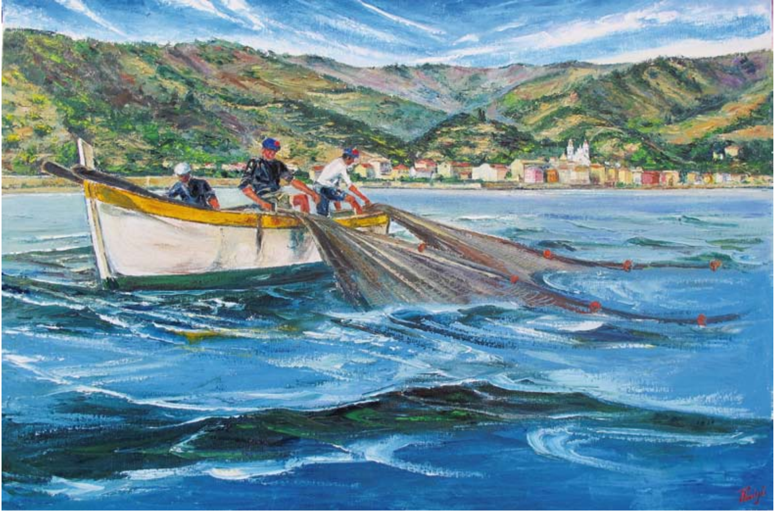
Pierluigi Colombo "Gàndua cù a sciàbica" - VL 1910 (olio su tela cm 80x120)