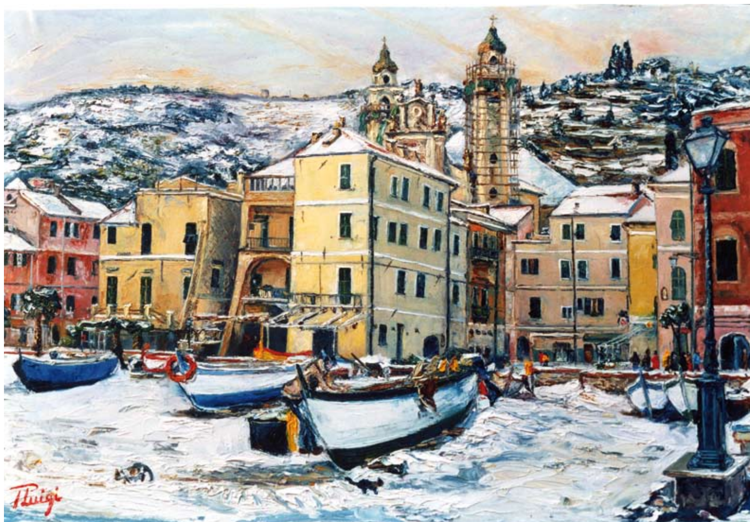
Pierluigi Colombo "Splendida Giornata" (olio su tela cm 40x60)