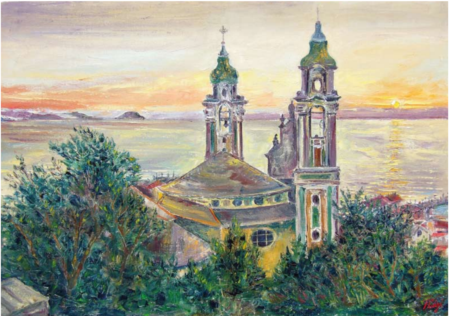
Pierluigi Colombo "L'aurora di San Matteo" (olio su tela cm 70x100 - collezione privata)