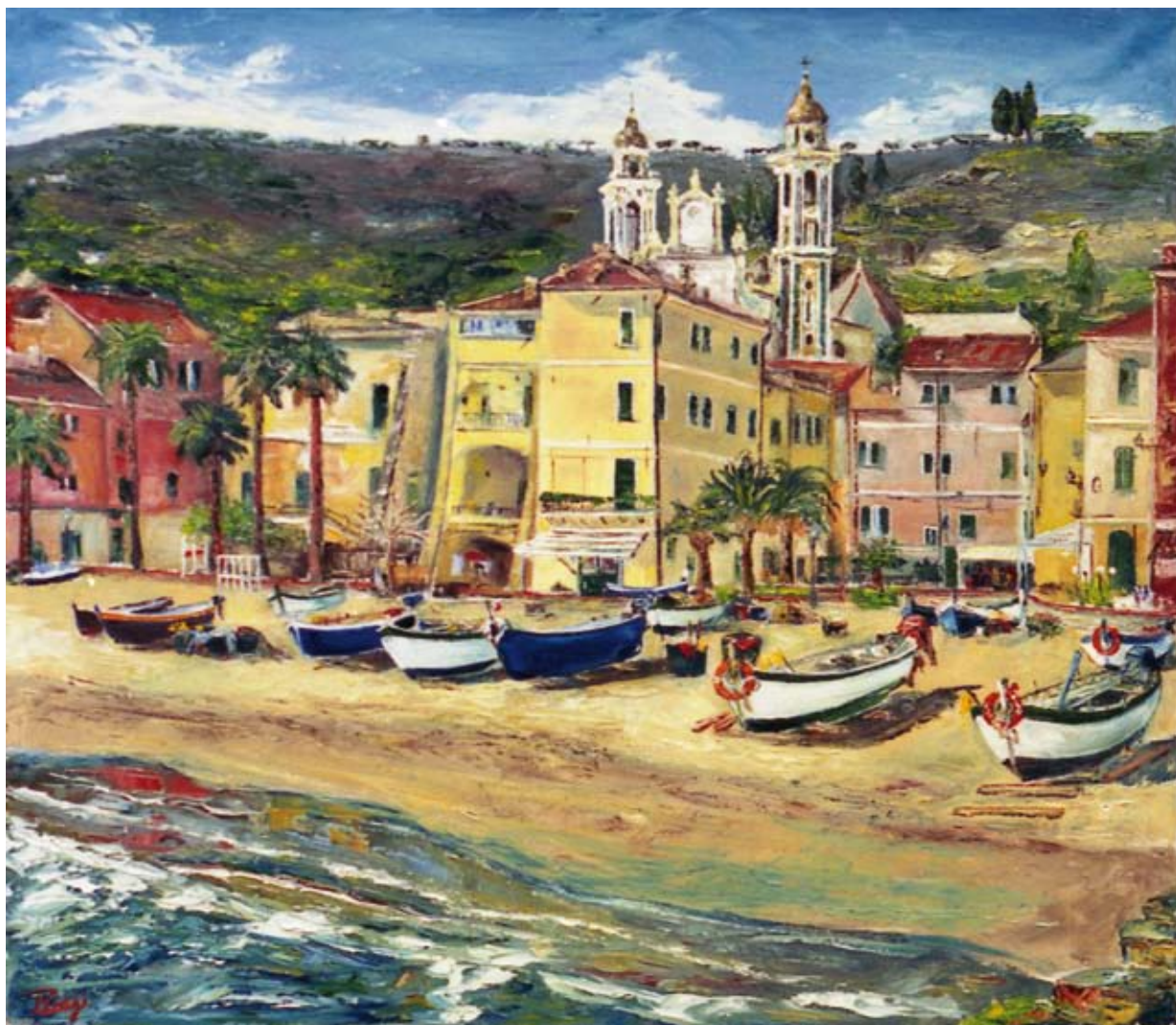
Pierluigi Colombo "Dolce Inverno" (olio su tela 70x80 - collezione privata)