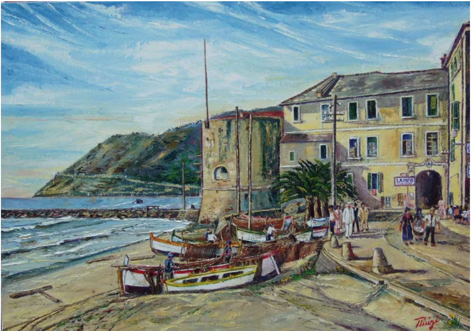
Pierluigi Colombo "Il Bastione e la Porta di Levante" - VL 1920 (olio su tela 70x100)