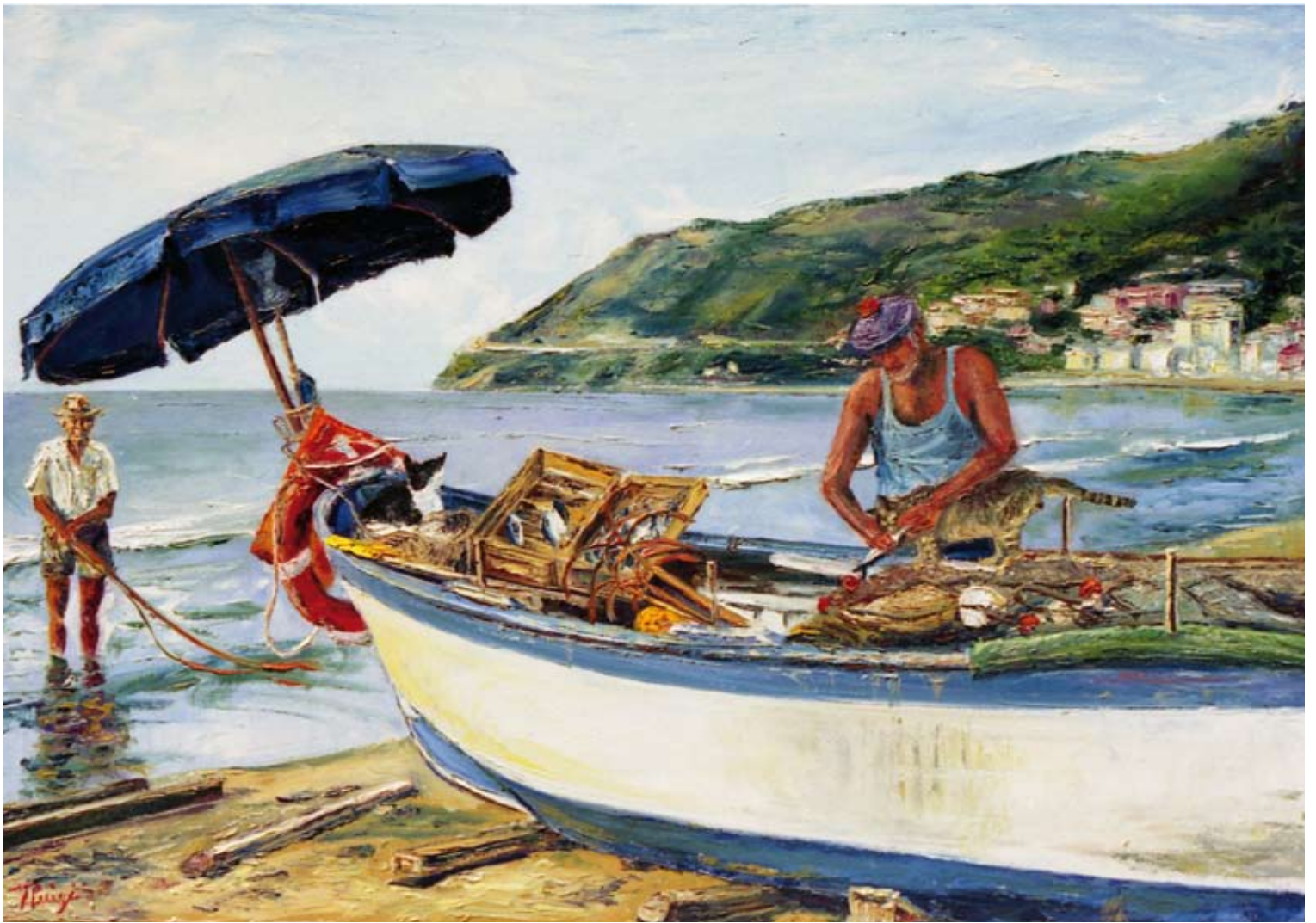
Pierluigi Colombo "Piero e i gatti" (olio su tela cm 70x100)