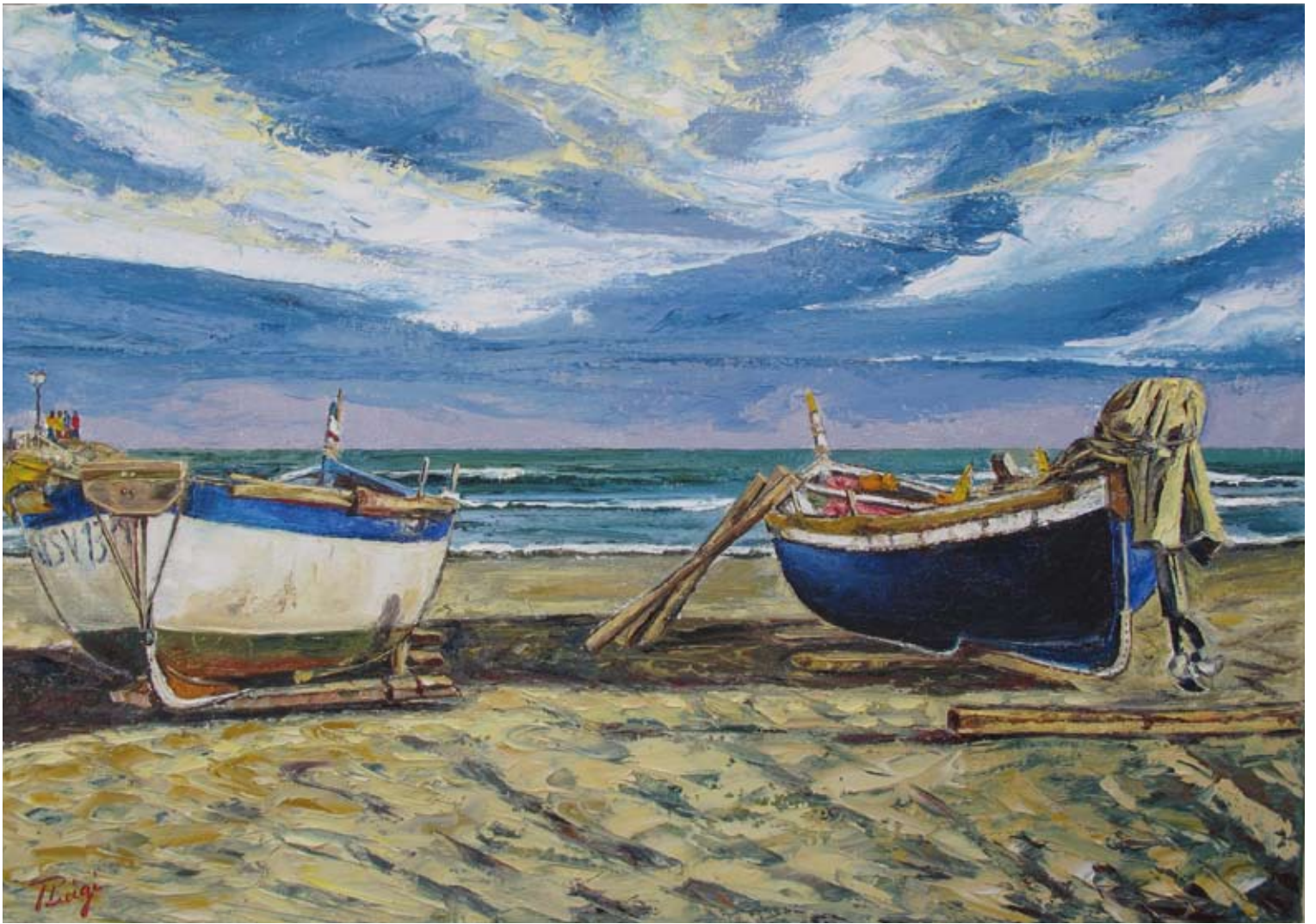
Pierluigi Colombo "Sapore di sale" (olio su tela cm 70x100)