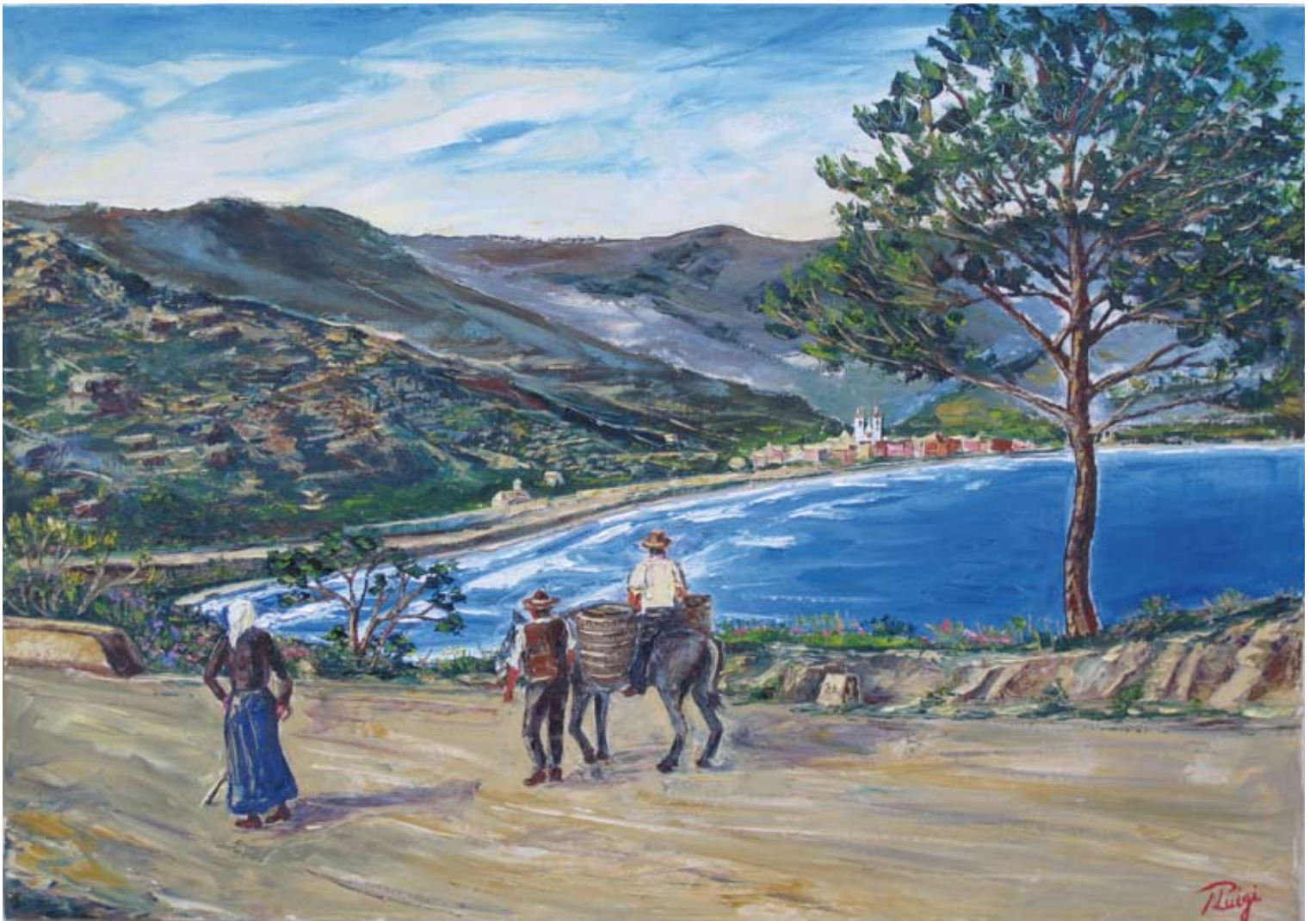
Pierluigi Colombo "Mareggiata da scirocco" - VL 1900 (olio su tela cm 70x100)