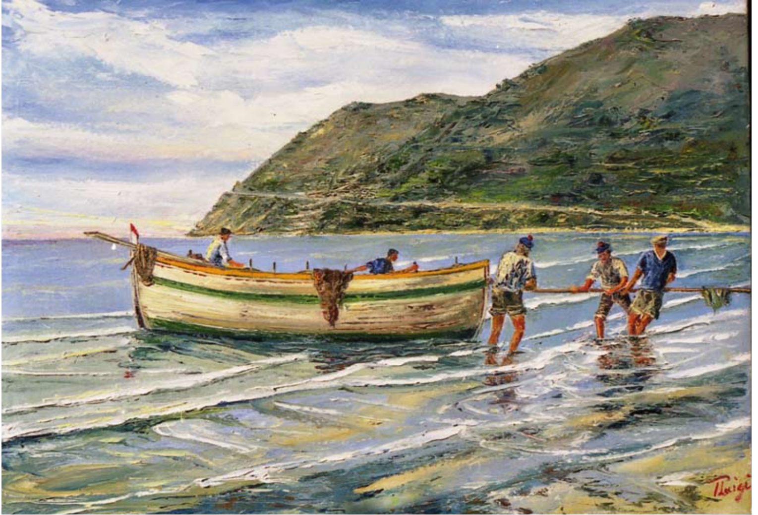
Pierluigi Colombo "I pescatori di Capo Mele" - VL 1905 (olio su tela cm 70x100)