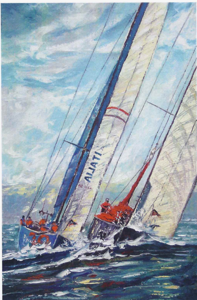
"Italian Challenge" cm 60x100

"L'artista avverte il bisogno di avere un contatto fisico con il colore, ... ...dichiara di "Scolpire con i colori" Manifesta un'intensa partecipazione allo spettacolo della natura. Una natura che Colombo percepisce senza inutili romanticismi... libero da pregiudizi e condizionamenti".