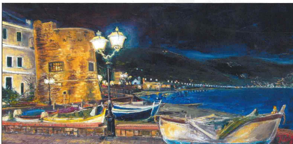
Sotto: Italian Challenge. Cm. 60 x 100. Tecnica: olio a spatola su tela.

venze coordinate dal moto del mare, in un sublime turbino di natura e sensazioni; di godibilità e analisi dei movimenti. I colori sembrano delicati, ma non del tutto. Racchiudono l'impeto dell'Artista e rispecchiano il carattere di chi mette la buona volontà in ogni azione.